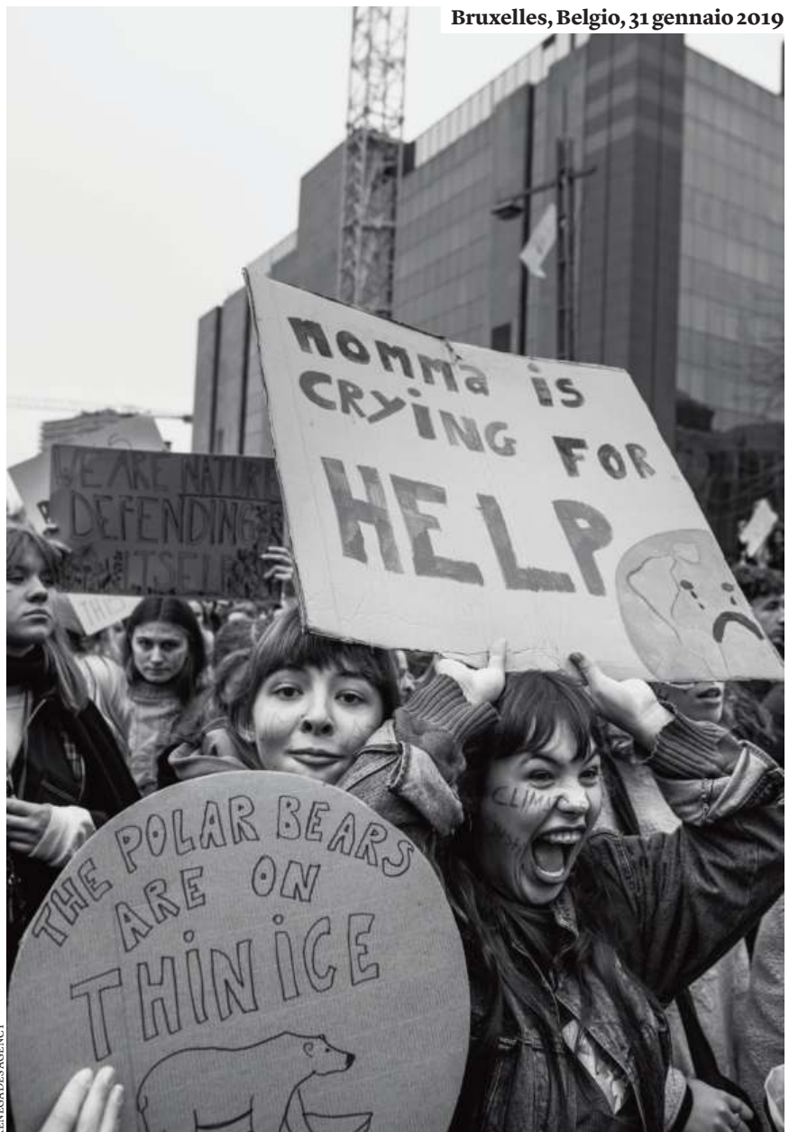
Bruxelles, Belgio, 31 gennaio 2019