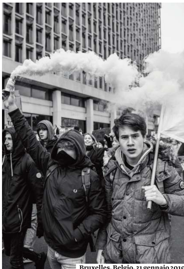
Bruxelles, Belgio, 31 gennaio 2019